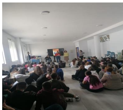
IES FERNANDO QUIÑONES. CHICLANA DE LA FRONTERA.

El libro también ha sido presentado en muchos institutos, y se seguirá presentando en más durante el siguiente curso. También, debido a la importancia de los temas que tratan, se ha puesto como lectura trimestral en algunos de ellos.