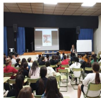
IES HUERTA DEL ROSARIO CHICLANA