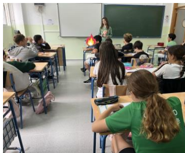
IES ROCHE. CONIL DE LA FRONTERA